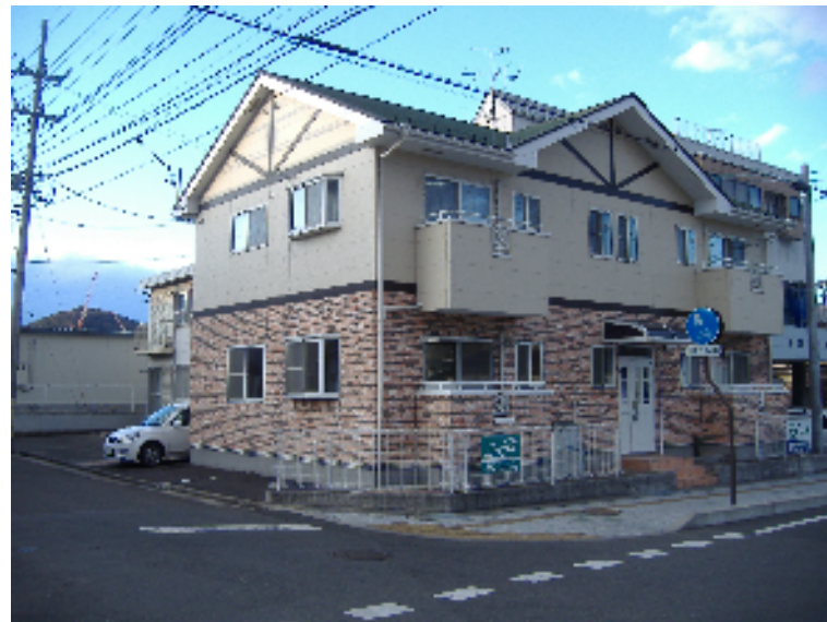
メゾンファースト