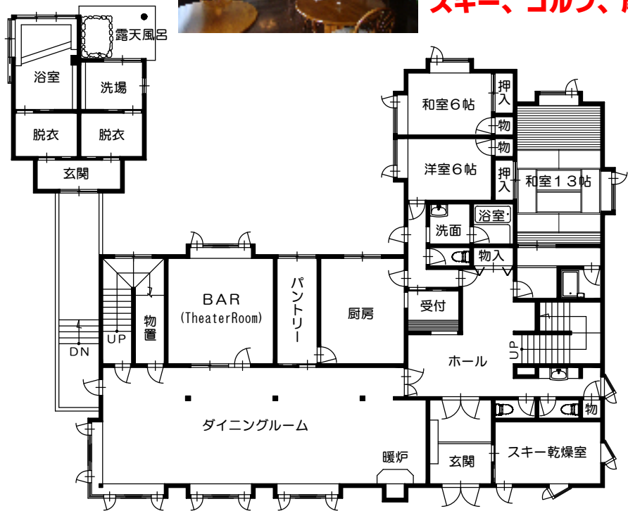
1階平面図（地階はボイラー室及び倉庫） ※平面図は現況優先